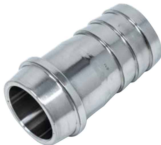
Portagomma Enologico Maschio Italian oenological male rubber holder