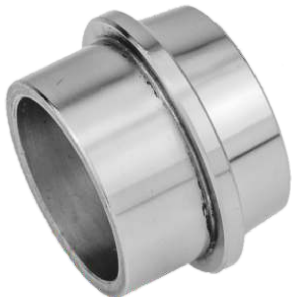
Raccordo Enologico Maschio a saldare Italian oenological welding liner