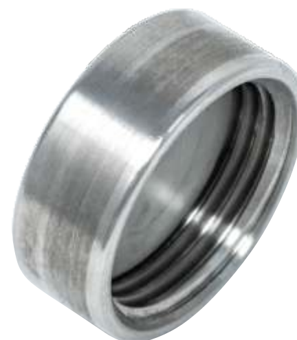
Tappo enologico- Italian oenological cap Liner-male italian oenological reduction