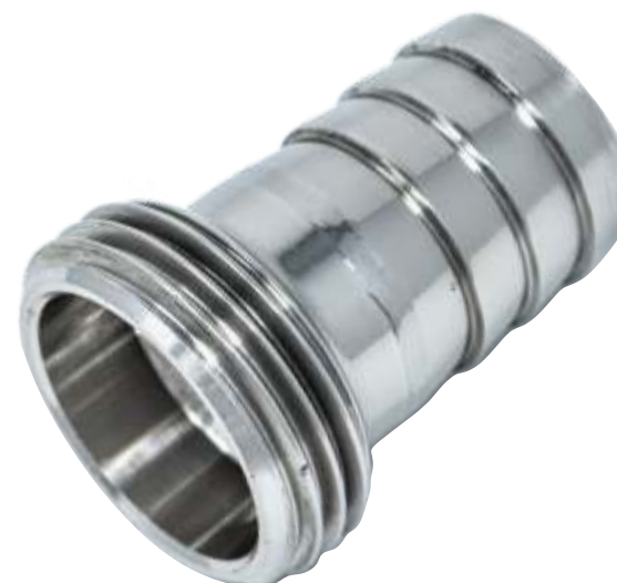
Portagomma Enologico Femmina Italian oenological liner rubber holder