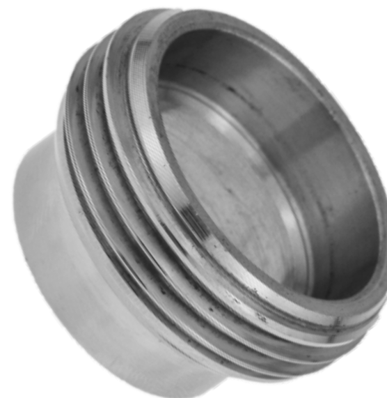
Raccordo Enologico Femmina a saldare Italian oenological welding male