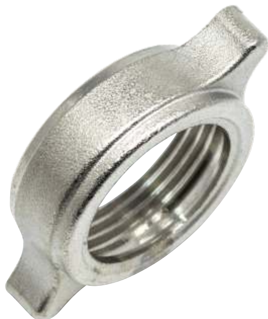
Girello enologico Italian oenological nut